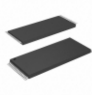
AT29C512-90TC Microchip Technology IC FLASH 512KBIT 90NS 32TSOP