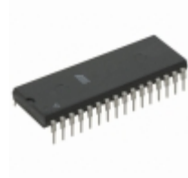
AT29C512-90PC Microchip Technology IC FLASH 512KBIT 90NS 32DIP