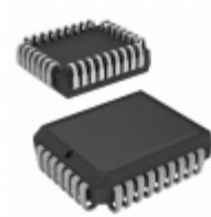
AT29C512-90JU Microchip Technology IC FLASH 512KBIT 90NS 32PLCC