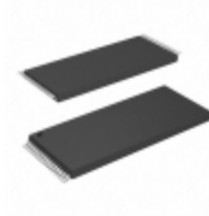
AT29C512-90TU-T Microchip Technology IC FLASH 512KBIT 90NS 32TSOP