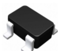
BU4810F-TR Rohm Semiconductor IC VOLT DETECTOR 1.0V SOP4