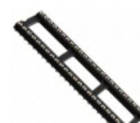
BU480Z-178-HT On Shore Technology Inc. CONN IC DIP SOCKET 48POS GOLD