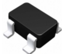
BU4809F-TR Rohm Semiconductor IC VOLT DETECTOR 0.9V SOP4